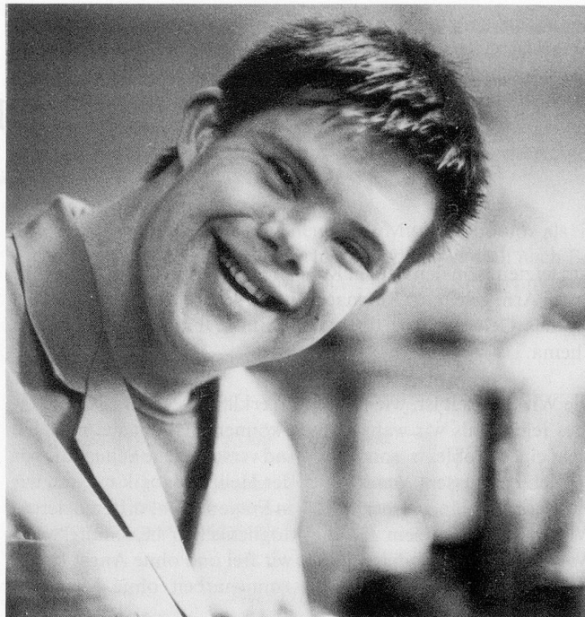
Mit der Welt zufrieden . . .

Die Werkstattleiter sind gerne zum Gespräch bereit.