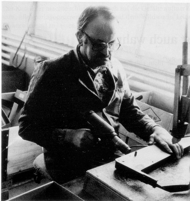
Ein neues Arbeitsgebiet: Die Demontage von gebrauchten Farbbandern.

«Eigentlich sollten wir schreiben: Liebe potentielle Arbeitgeber, versteht uns, wenn wir schreiben oder telefonieren: Habt Ihr Arbeit?» sinniert Hug. «Eine Werkstatt mit beispielsweise 200 Behinderten, mit täglich 8 Stunden Beschäftigung . . . dies verlangt viel Einsatz bei der Akquisition.» Aber es lohnt sich immer wieder. So steigt die Lenzburger Stiftung ins Recycling-Geschäft ein und wird führend bei der Wiederverwertung von gebrauchten Farbbandkassetten. Hier hat sich die Zusammenarbeit mit einem regional ansässigen Kassetten-Grossisten ergeben.