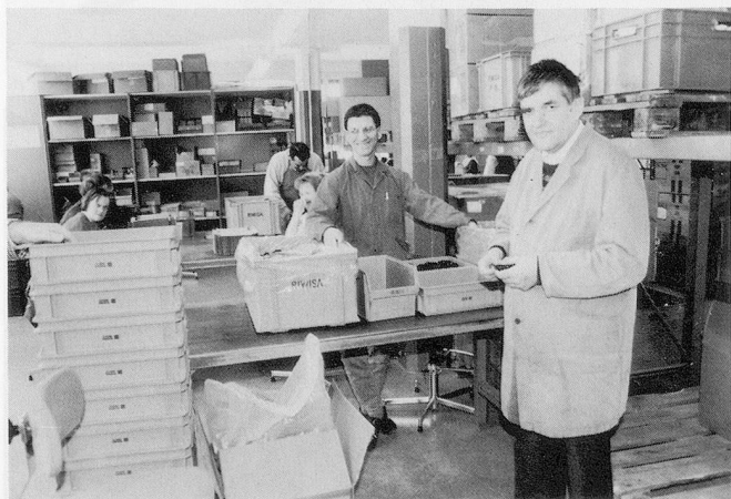
Im Einsatz für die Elektrobranche.

In Lenzburg wird derzeit ein Werbebrief vorbereitet, der an alle Gewerbetreibenden und Betriebe der Region verschickt werden soll.