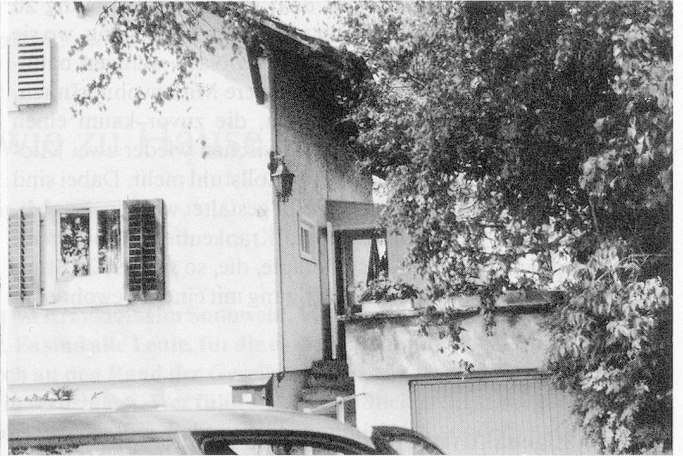
Einblick in die Küche der Wohnung der zweiten Alters-Wohngruppe und Aussenansicht des Privathauses, in dem die dritte Alters-Wohngemeinschaft entstanden ist.