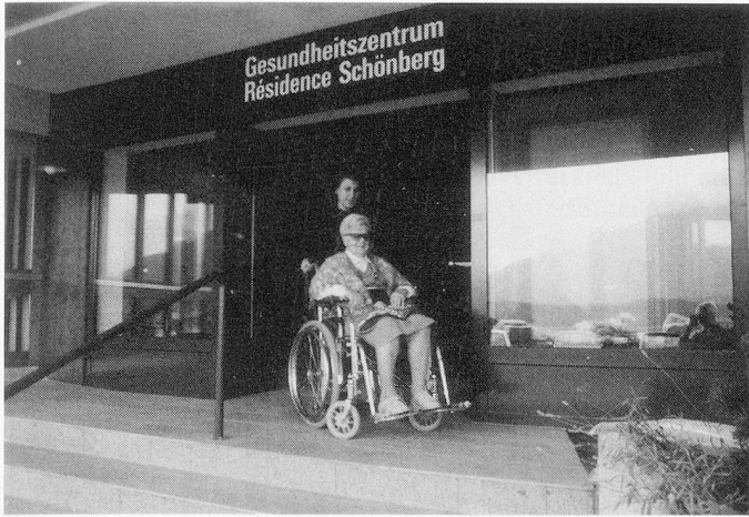
Die Résidence Schönberg ist rollstuhlgängig; guter Teamgeist in der Küche.