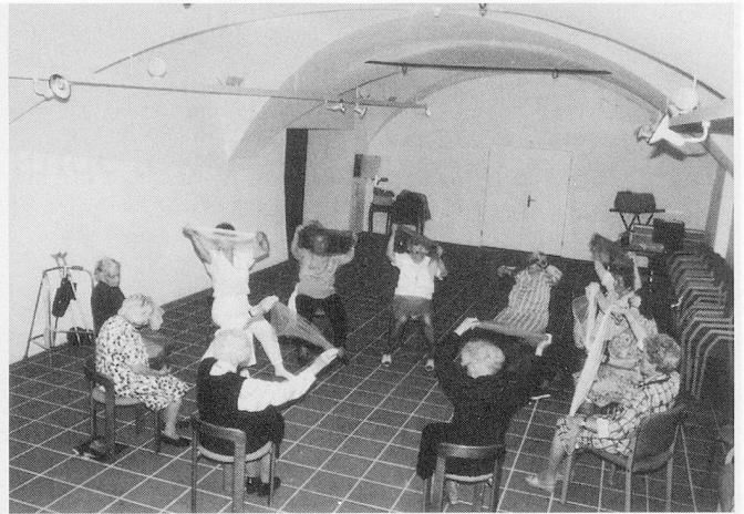
Mit Musik geht alles leichter: eine aussergewöhnliche Turnstunde in Gunten.

Anfragen unter Chiffre V 920801, Admedia AG, Postfach, 8134 Adliswil.