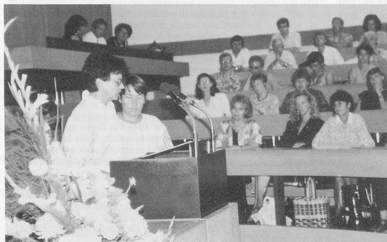
Rückblick... aus der Sicht der Kursabsolventinnen.