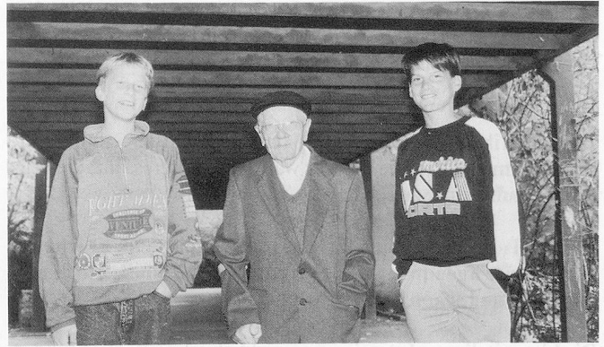
Kontakt der Generationen

Es hat mich wirklich erstaunt, wie gut sie sich an die Sachen erinnern konnte, die wir gefagt hatten. Manchmal hat sie auch was verdreht oder eine falsche Antwort gegeben. Aber das passiert wahrscheinlich jedem ab und zu. Zum Beispiel: Als wir sie fragten, wieviele Kinder sie hat, zählte sie uns zuerst ihre Enkelkinder