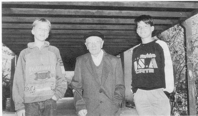
Kontakt der Generationen

Es hat mich wirklich erstaunt, wie gut sie sich an die Sachen erinnern konnte, die wir gefragt hatten. Manchmal hat sie auch was verdreht oder eine falsche Antwort gegeben. Aber das passiert wahrscheinlich jedem ab und zu. Zum Beispiel: Als wir sie fragten, wieviele Kinder sie hat, zählte sie uns zuerst ihre Enkelkinder