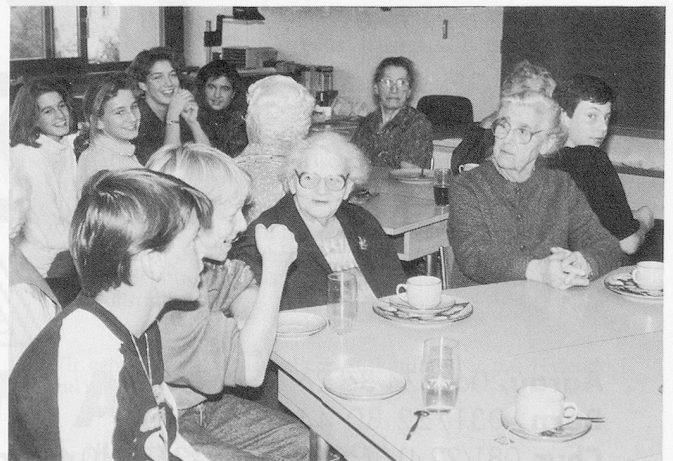
Nach dem Umzug: Die Schülerinnen und Schüler bewirteten ihre Gäste im Klassenzimmer.

Am Schluss hat sie uns noch kleine Schokoladetäfelchen gegeben, die sie extra in Brugg gekauft hatte. Dann zeigte sie uns noch