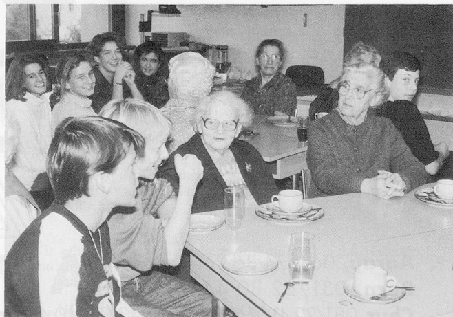
Nach dem Umzug: Die Schülerinnen und Schüler bewirteten ihre Gäste im Klassenzimmer.

Am Schluss hat sie uns noch kleine Schokoladetäfelchen gegeben, die sie extra in Brugg gekauft hatte. Dann zeigte sie uns noch