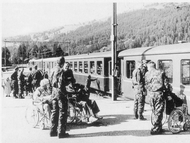
In Rodels stand der RhB-Sanitätszug bereit.

Eine Spit Abt, die ein ganzes Spital betreibt, ist ein kompliziertes Gebilde, in dem Spezialisten verschiedenster Berufe und Fachrichtungen zusammenarbeiten. Unter den 36 Ärzten gibt es Chirurgen und Internisten, des weiteren einen Frauenarzt, einen Kinderarzt, einen Augenarzt und andere. Hinzu kommen sieben Zahn-