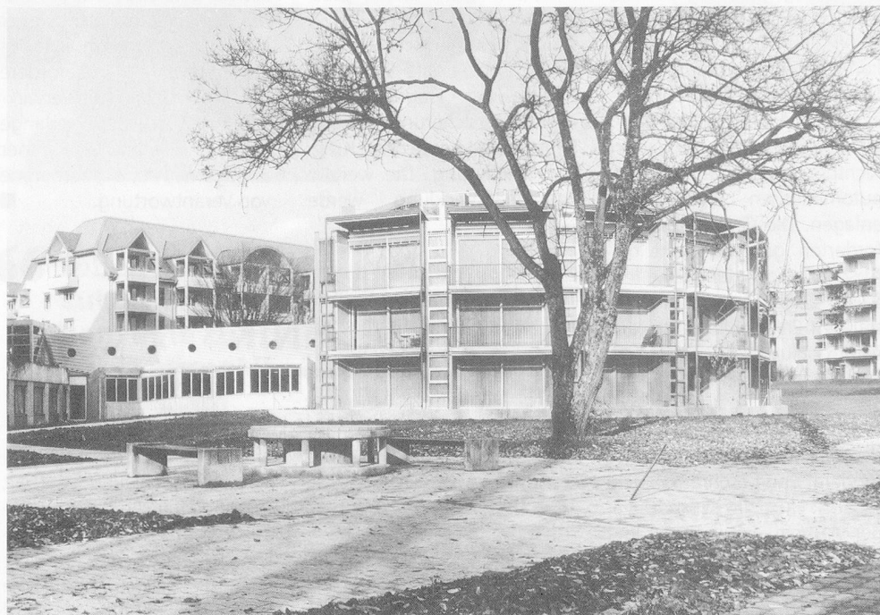
Alterswohnheim Am Wildbach, Wetzikon

Der Erweiterungsbau des Alterswohnheimes Am Wildbach, Wetzikon, für den am 4. Juni 1989 der Kredit bewilligt wurde, ist fertig; die ersten Bewohner sind eingezogen. In einer schlichten Einweihungsfeier wurde das Bauwerk dem Betrieb übergeben.