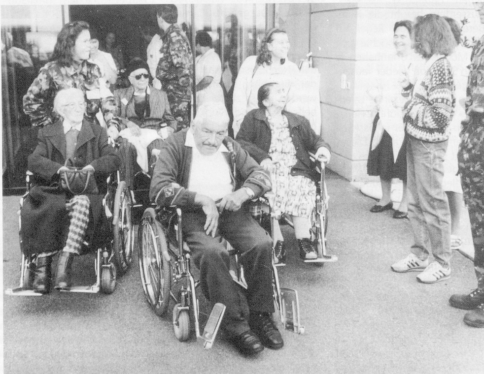
Vor dem Alters- und Pflegeheim in Fürstenaubruck warten Patienten und Patientinnen gespannt darauf, von Armeeinghörigen gepflegt zu werden.

Zwischen einigen Betreuenden und Betreuten baute sich in dieser kurzen Zeit eine herzliche Beziehung auf. So war es verständlich, dass mit dem Anbrechen des letzten Tages die Stimmung im «Camp» etwas bedrückend wurde. Die Tatsache annehmend, dass auch alles Schöne einmal ein Ende hat, erleichterte manchem Heimbewohner den Weg zurück in den Alltag. Was geblieben ist, sind die vielen schönen Erinnerungen. Auch heute noch, Monate später, liefern sie Stoff für manches Gespräch.