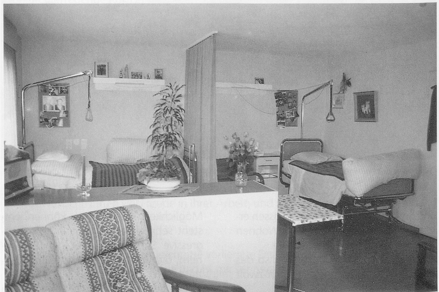
Es kamen viele positiven Reaktionen.

Als erstes waren wir natürlich sehr gespannt auf die Reaktionen und Kom-