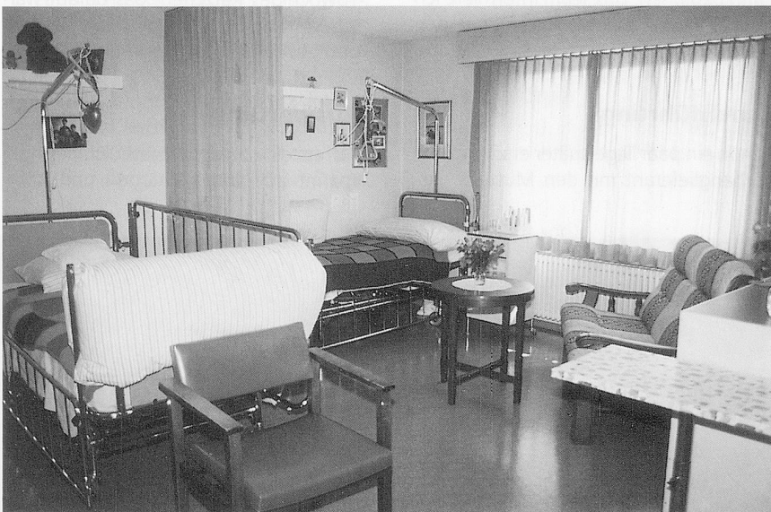
Durch Trennvorhänge kann die Intimsphäre besser gewahrt werden.

Von verschiedenen Bewohnern habe ich im Gespräch erfahren, welches ihre eigentlichen Wünsche und Bedürfnisse