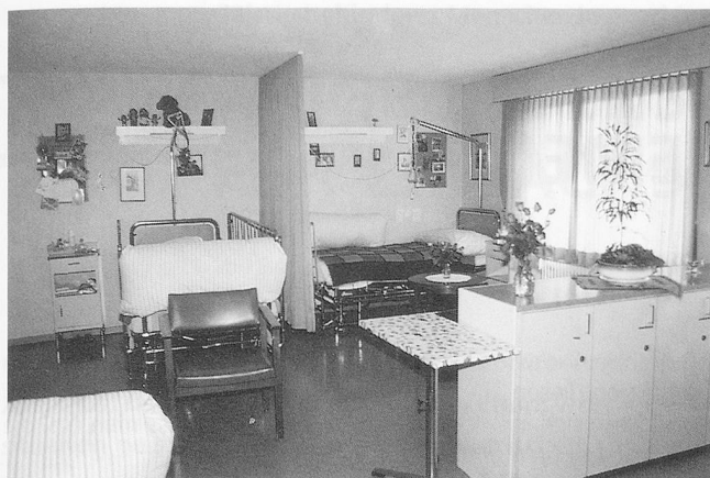
Platz für einen Lieblingssessel neben dem Bett.