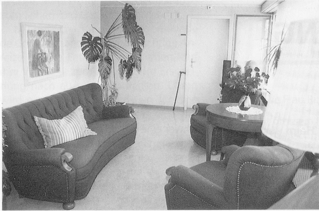
Ein heimeliges Stübli.

in bezug auf Wohnen, Gemeinschaft und tägliche Gewohnheiten sind.