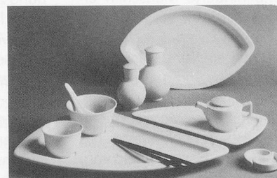
Table Ware» hat sich die Porzellanfabrik Langenthal an der Igeho in Basel erstmals als Komplett-Anbieter für den «Gedeckten Tisch» im Gastronomiebereich vorgestellt. Die neue Vertriebsorganisation bietet alle vier Geschirrmarken der Keramik Holding AG Laufen (Langenthal, Lilien, Pillivuyt, Karlovy Vary), eigene Glas- und Besteckmarken

(Laufen) sowie Tafelgeräte (Balzano for Laufen) an. Das Angebot umfasst Hotelporzellan aus vier Kulturkreisen mit mehr als 25 Linien und über 120 Dekoren, ausgesuchte Glaswaren, exklusive Tafelgeräte sowie Besteck. Zum Kundenkreis der Laufen United Table Ware in Langenthal zählen Hotels, Restaurants, Heime, Spitäler sowie Grossabnehmer. ■