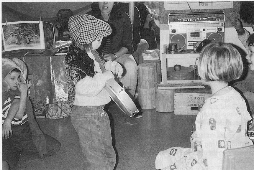
Das soziale Umfeld ist für ein Kind wichtig, auch der Kindergarten gehört dazu.

Im ersten Bereich sind die Sonderschulen zusammengefasst, im zweiten die Sonderschulheime. Durch das aktuelle angewandte WHO-Klassifikationssystem gelten in Frankreich heute weniger Kinder als geistig behindert als früher; ein Teil von ihnen wird seither in die Normalklassen integriert und gestützt, während die Zahl der Förderklassen am Abnehmen ist. Auf der Sekundarstufe sind aber diese Förderklassen in den letzten