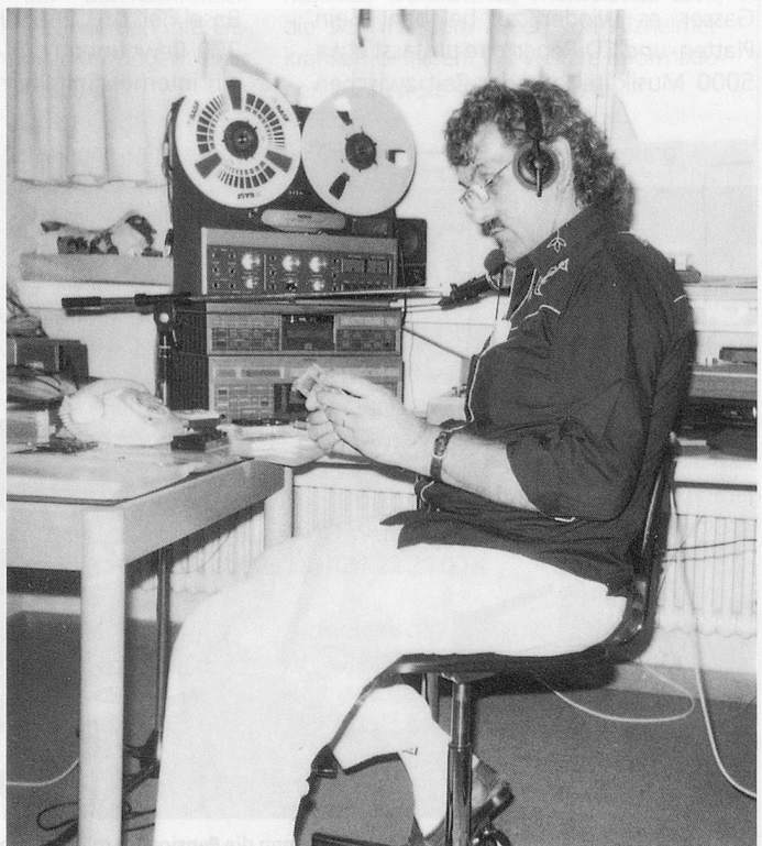
Radio Kühlewil: Ein eigener Sender seit 1986.

Eine zweite Ausbaumöglichkeit erhält das Projekt, wenn die Dimension Öffentlichkeitsarbeit mitgedacht wird. Text-, Ton- oder Bildbeiträge, die von «drinnen», vom Innern einer Institution, berichten, können für die «draussen», die breite Bevölkerung, nützlich sein. Dies im Sinne eines Versuchs, Öffentlichkeitsarbeit und Sozialarbeit zu verbinden. ■