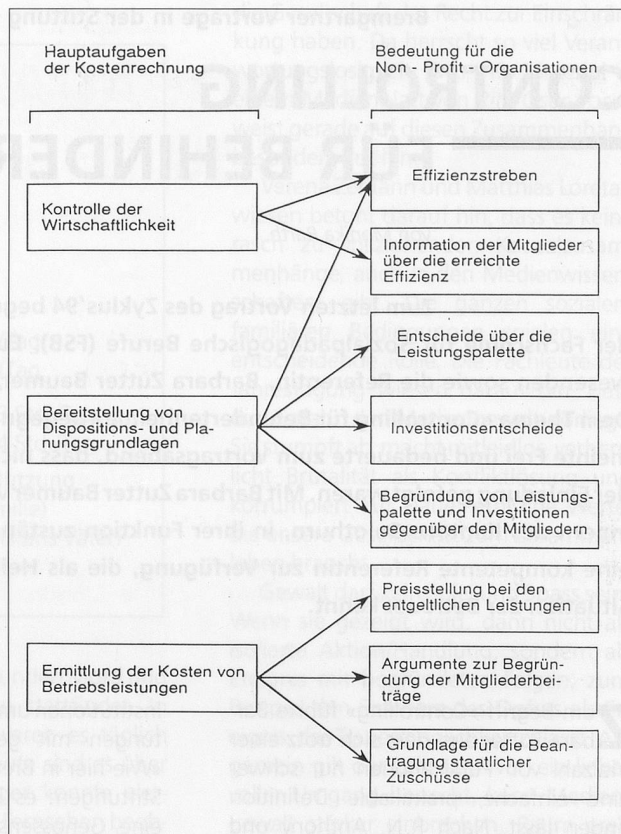
Abbildung 2: Hauptaufgaben von Kostenrechnungen und ihre Bedeutung in Nonprofit-Organisationen