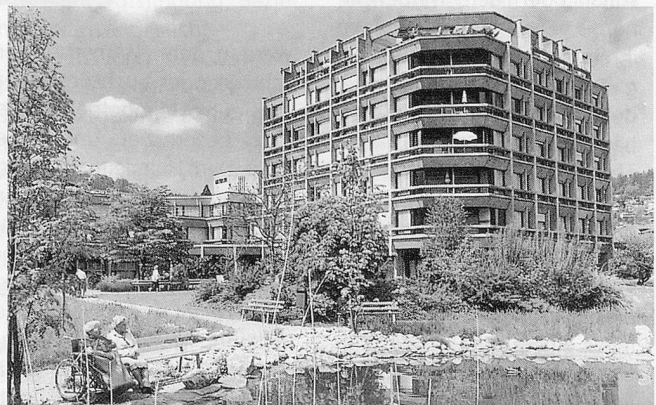
Die Krienser Altersheime Grossfeld und Zunacher: «Jetzt können wir uns um den inneren Aufbau kümmern.»