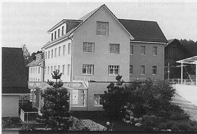
Renovation und Ausbau von A bis Z gelungen!

An Betreuern und Bewohnern liegt es nun, die neugestalteten Räume mit Leben zu erfüllen. ■