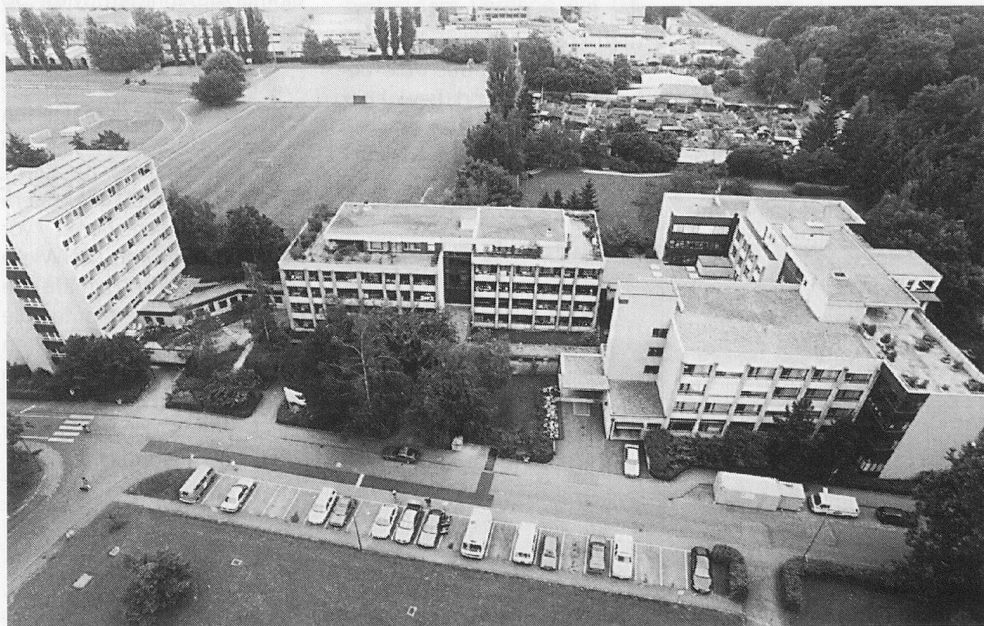
Offenes Heimkonzept – kein Widerspruch zur Sicherheit im Alters- und Pflegeheim Birsfelden: In den Alters- und Pflegeheimen «Rebacker» (links), zur «Hard» (rechts) und der Alterssiedlung (Mitte).

Am Ende wurden im Birsfelder Alters- und Pflegeheim «Zur Hard» fast alle Kriterien erfüllt – nur standortbedingte Risikofaktoren wie die Hafennähe lassen sich eben nicht beheben. Bereits werden aber weitere Sicherheitsinvestitionen (Schliessanlage, Videoüberwachung usw.) für etwa 356 000 Franken geplant, die der Kanton Baselland zu 45 Prozent subventioniert. Heute gilt der Sicherheitsstandard im Haus zur «Hard» als «ausgezeichnet»; da darf man auf die Wortwahl anlässlich der in zwei Jahren fälligen FSIB-Neuprüfung gespannt sein. ■