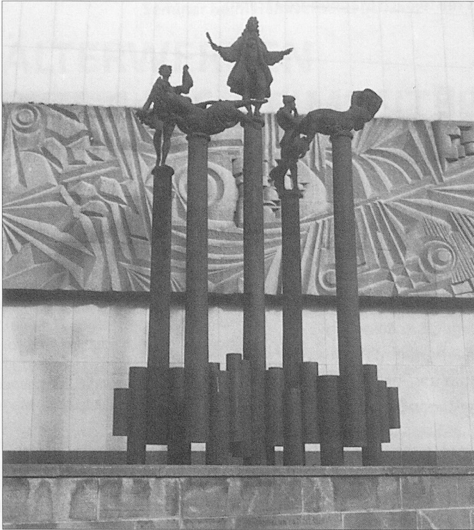
Telemann mit seinen Musen...

leicht meinte die junge Frau gestern dies: Magdeburg ist keine Idylle, wo heimelige Altstadtfassaden eine falsche – äusserliche – Kontinuität vorgaukeln. Zerstört ist zerstört: 90 Prozent des Stadtzentrums lag 1945 in Trümmern. In der Nachkriegszeit wurde das Stadtbild geprägt durch weitläufige, breite Verkehrsanlagen, pompöse stalinistische Prachtsbauten und durch die kahlen Blöcke des Industriefertigbaus. Und trotzdem: die Geschichte ist gegenwärtig, nicht nur die neuere, auch die ältere, wie sie uns heute im Dom aufgezeigt wurde. Je weniger sichtbare Spuren vorhanden sind, um so bewusster muss man sich aus diesem Wenigen die Bezüge, den Überblick «erschaffen». Die Brüche, die Risse, die Kluft zwischen den Stilen wecken auf – zwingen, über Zusammenhänge nachzudenken, die (geistige) Brücke zu schaffen.