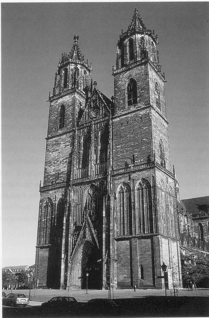
Die Türme des Doms in Magdeburg.

pisch für die niedersächsische Baukunst sind die farbigen Holzschnitzereien an den Häusern, besonders auffällig die Fächerpalmetten oder Sonnenräder. Echte Hochstuhlhäuser treffen wir an unserem Rundgang, entlang älterer, aber auch neuerer Geschichte: Wessis, die alte Häuser erwerben und dann in Konkurs gehen, oder noch schlimmer, weil beabsichtigt, keine Investitionen tätigen, die Häuser verfallen lassen, sie dann abreißen und teures Bauland verkaufen wollen – wir hatten eine wunderbare Stadtführerin, eine echte Brockenhexe mit träfen Sprüchen und spitzer Zunge, kritisch (nicht nur gegenüber den Wessis), aber humorvoll – vielleicht eher Galgenhumor, aber anders, so ist es mir heute manchmal vorgekommen, sind Absurditäten in der neueren deutschen Geschichte gar nicht anzugehen. Dann der Besuch der Burg, etwas neben der Stadt gelegen, und der den Hügel krönenden Stiftskirche des Damenstiftes von Quedlinburg, gegründet von Mathilda, der Gattin Heinrichs I., samt Domschatz und wunderbar ausgemalter Krypta – ein herrliches romanisches Gebäude (1129