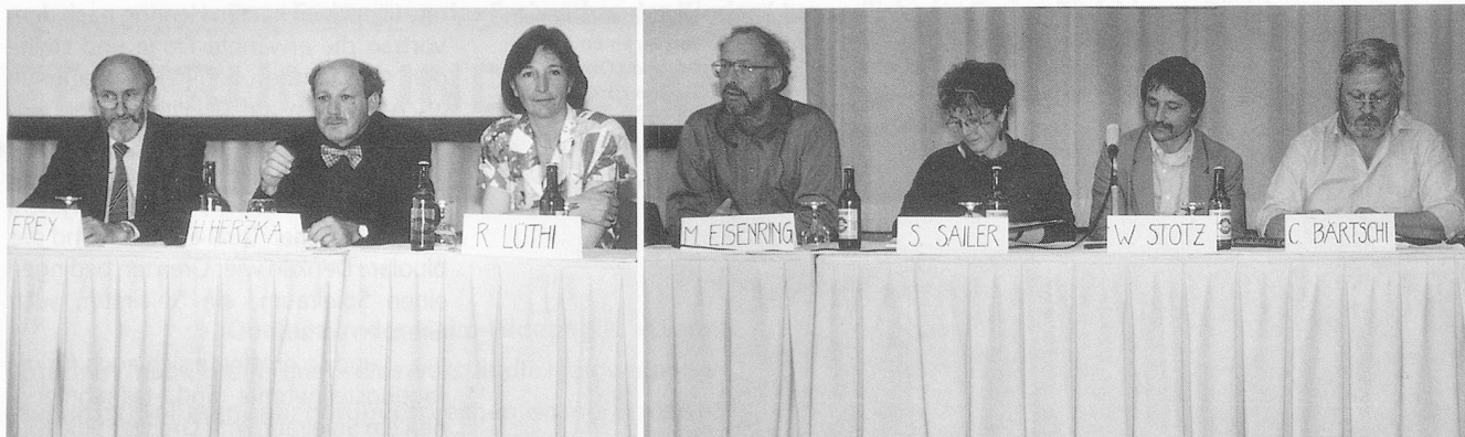
Eine kompetente Podiumsrunde.