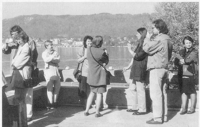
Auf der sonnigen Terrasse lässt es sich gemütlich diskutieren.