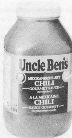
Uncle-Ben's-Sauce Minute «Chili»: Temperamentvoll wie die Natur Mexikos.

Elro-Werke AG Wohlerstrasse 47 5620 Bremgarten Telefon 057 3091 11