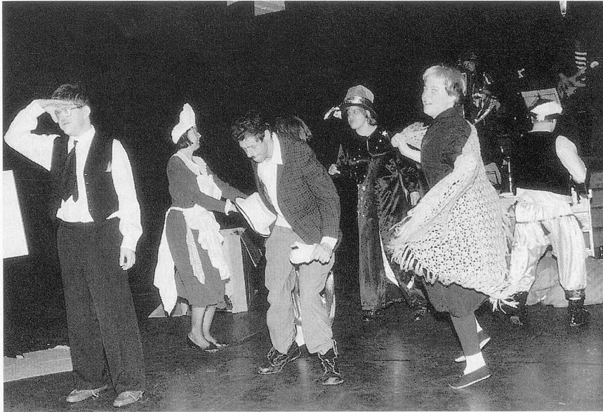
«... und jetzt wird tanztet».