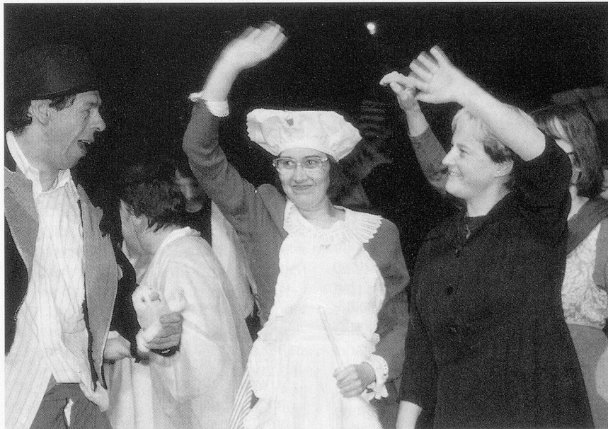
Wir danken für den Applaus.

Theaterbesuchern «die Türe zum Herzen» öffnen.