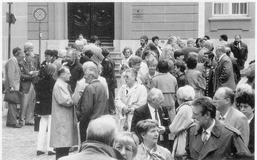
150 Jahre: Für die gediegene Jubiläumsfeier ...