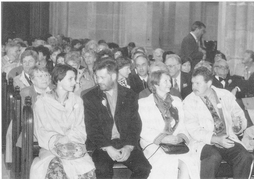
... gemeinsam ins Berner Münster.

Altstätten. Diese gut besuchte und gut gelungene Veranstaltung in der Ostschweiz, in der im Jahre 1848 der zweite Regionalverein unseres Verbandes ins Leben gerufen wurde, war ein passender Abschluss des Jubiläumsjahres.