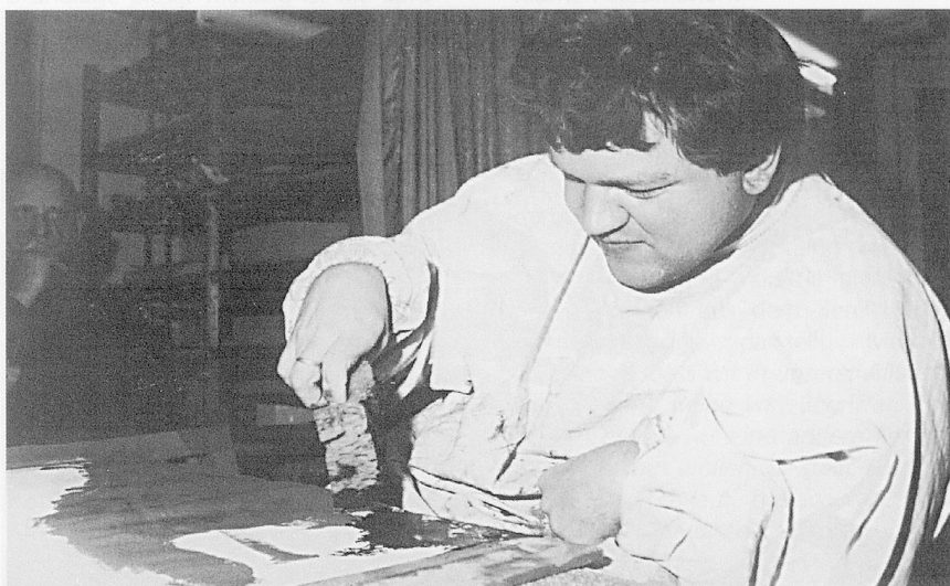
Bilder der Seele