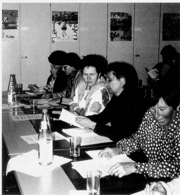
Staunen: Ob es sich um einen Frauenkurs handelt?