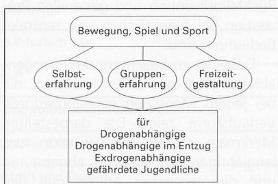
Abb. 1. Bewegung, Spiel und Sport – ein manchmal vergessenes Angebot in der Suchtprävention.

Je nach Art der konsumierten Substanzen vermittelt der Drogenkonsum erregende, dämpfend schmerzlindernde, oft auch veränderte oder dissoziiert erlebte Körpererfahrungen.