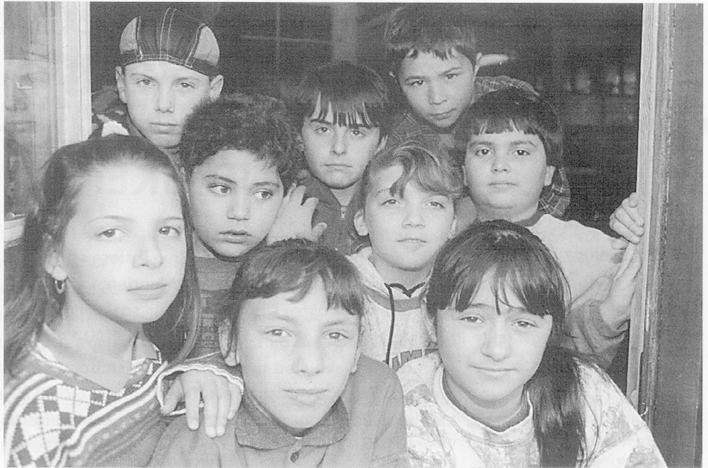
So verschieden die Gesichter sind die Sprachen, die in der Integrationsklasse im Kinderdorf Pestalozzi gesprochen werden.

Familienbegleitende internationale und nationale Hausgemeinschaften: Hier werden Kinder und Jugend-