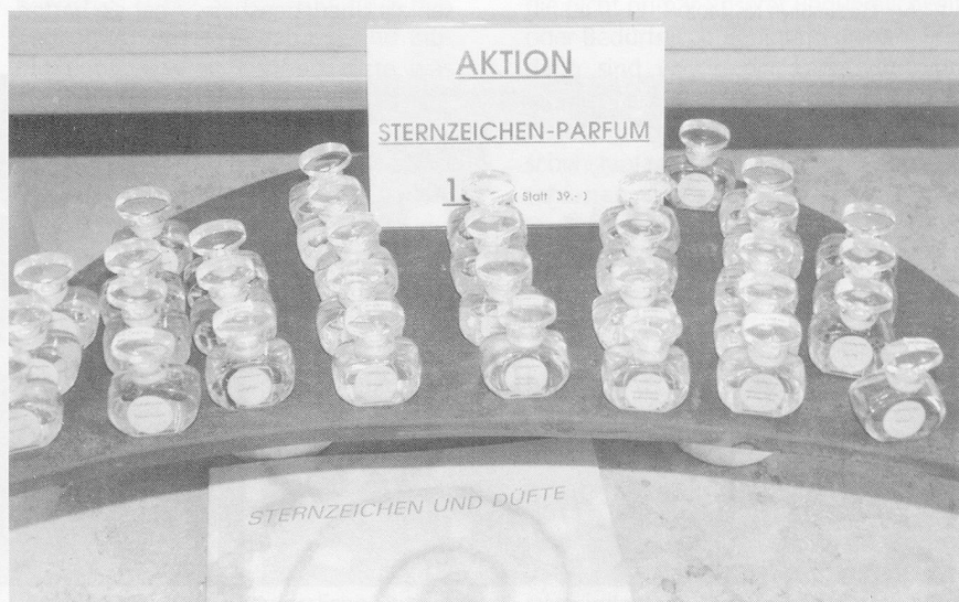
Fotos Erika Ritter (geknipt im Farfalla-Duftladen an der Seefeldstrasse 18, Zürich)

Der Kauf ätherischer Öle ist weitgehend eine Vertrauenssache, und es lohnt sich, das Gespräch mit der Fachfrau, mit dem Fachmann im Duftladen zu suchen. «Es bestehen sehr grosse Qualitätsunterschiede», äusserte sich ein Duftfachmann mir gegenüber. «Neben ätherischen Ölen erster Güte kommen synthetische Erzeugnisse in den Handel. Und es wird munter drauflosgepanscht.» Mehr Gewähr für Qualität besteht bei jenen Duftläden, die ihre Essenzen aus biologischem Anbau, den sie an Ort und Stelle selber oder durch Gewährsleute überwachen, beziehen. Hier werden strenge Massstäbe für Anbau, Pflege und Ernte angelegt. Eine schwierige Aufgabe für die Nase eines Laien, eine echte Essenz von einem Verschnitt oder einer Fäl-