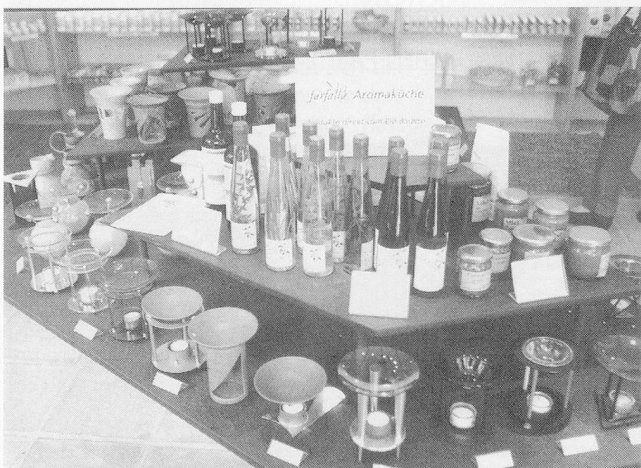
Duftlichter: Wohlgerüche in der Wohnung.

noch einen andern, einen anmutigen Zweck, der schon lange vorher geschätzt wurde. Düfte aus der Natur heitern die Seele auf und tragen damit wesentlich zum allgemeinen Wohlbefinden bei. Zwischen unserer Nase und unserem emotionalen Empfinden besteht ein enges Zusammenspiel. Gerüche beeinflussen unsere Gefühlswelt viel stärker, als wir ahnen. Oder wie lässt sich denn erklären, dass uns das Einatmen eines unerwarteten Duftes um Jahrzehnte zurückversetzen kann? Sehr deutliche Erinnerungen an die Kindheit an Menschen, Begebenheiten und Erlebnisse werden geweckt, die längst in tiefere Bewusstseinschichten gesunken, die «begraben» und vergessen waren. Die Aromatherapie, die Anwendung ätherischer Öle zum körperlichen und seelischen Wohl des Menschen, deren Anfänge Jahrtausende zurückliegen, erfährt gegenwärtig eine neue Blütezeit. Bei äusserlicher Anwendung, zum Beispiel bei Akne, zur Förderung der Wundheilung, bei Sonnenbrand und Insektenstichen oder für Massage empfiehlt sich bei der heute stark gestiegenen Anfälligkeit auf Allergien eine vorgängige Probe auf Verträglichkeit. Ein Tropfen der unverdünnten Essenz wird auf die Haut des Innenarms eingerieben. Entsteht innert 48 Stunden keine Rötung, so kann das ätherische Öl ohne Bedenken äusserlich gebraucht werden.