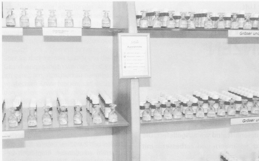
Ätherische Öle: Es riecht in allen Varianten.

Noch steckt viel Geheimnisvolles, Unerforschtes in den wohlriechenden Essenzen. Was aber jeder an sich selber erfahren kann: Pflanzendüfte wirken sich sehr positiv auf unser Gemüt aus und wecken lebensbejahende Kräfte. Wohlgerüche können belebend wie Musik oder Farben sein: Wohltaten, die viel mehr Platz in der Hektik des Alltags einnehmen sollten.