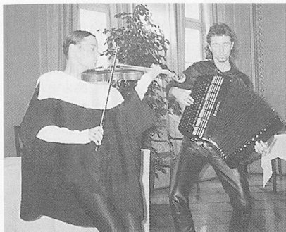
Leichtigkeit und Schalk: das Duo Jael in Aktion.

erkennung und nach Geborgenheit ernst genommen. Zudem passen Heime ihr Angebot heute an die nach Heimtyp verschiedenen Bedürfnisse der Betreuten an.