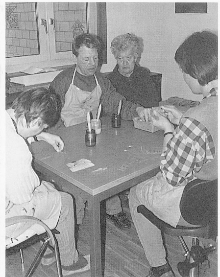
Wohnen im «Sternbild»: Blick aus dem Wohnzimmer; in der Küche dampft es; präzises Arbeiten mit Perlen.

quenz auch für den behinderten Bewohner im Heim gültig werden zu lassen. Ausserdem wird davon ausgegangen, dass jeder Mensch die Fähigkeit hat, ein Leben lang zu lernen. Deshalb wird im «Sternbild» nach dem Normalisierungsprinzip gearbeitet, man versucht, auf den Fähigkeiten (Ressourcen) aufzubauen; nicht durch Therapien, sondern durch gemeinsame Alltagsgestaltung , durch ganzheitliche Betreuung und Begleitung des einzelnen Bewohners wird das Ziel angestrebt, das folgendermassen beschrieben wird: «Das Ziel ist, eine optimale Selbständigkeit während seines ganzen Lebens anzustreben und somit seine persönliche Lebensqualität zu erhöhen. Es soll ihm im Alltag ermöglicht werden an der Vielfalt des Lebens aktiv teilzunehmen, soweit es mit den individuellen Voraussetzungen vereinbart werden kann.»