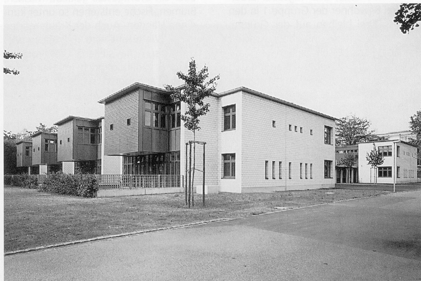
Das Wohnheim «Sternbild» auf dem Areal der Psychiatrischen Klinik Königsfelden.

Die Grundlage der praktischen Arbeit im Heim beruht auf einem Menschenbild, das versucht, Gleichheit und Würde aller Menschen in ganzer Konse-