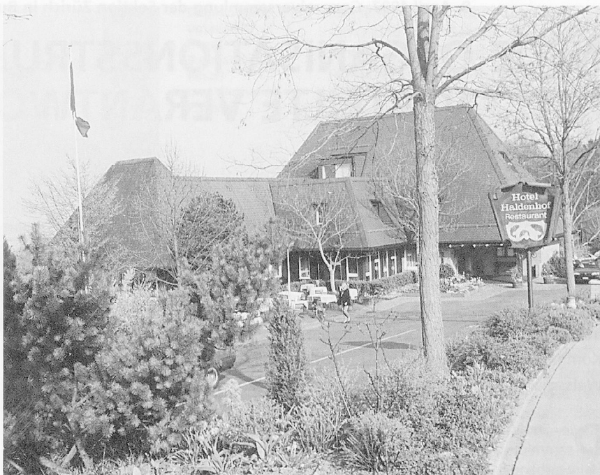
«Traditioneller» Tagungsort: der Haldenhof in Fruthwilen.