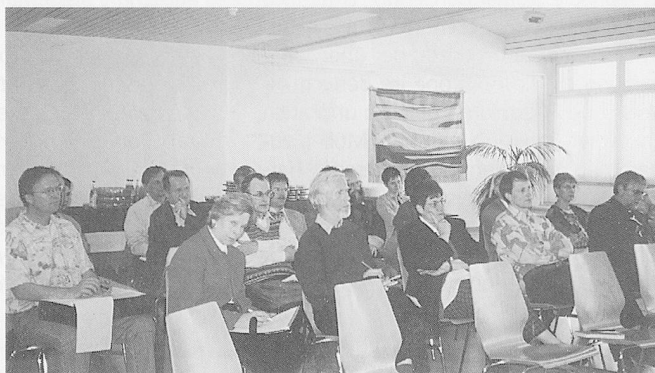
Im Vorstand... und bei den Mitgliedern herrschte eher eine gedrückte Stimmung.