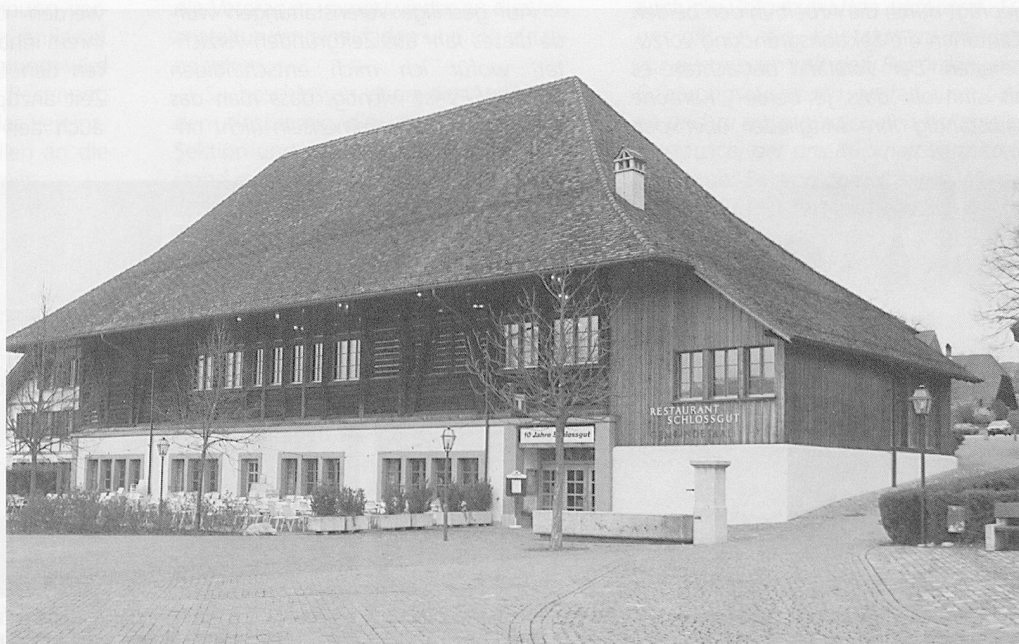
Das Schlossgut in Münsingen: ein stilvoller Tagungsort.

Eines ist klar, und das kann ich Ihnen aus Erfahrung sagen: Beim noch so detaillierten Arbeitsvertrag ergeben sich immer wieder Probleme und Auslegungsfragen, die gelöst werden müssen.» ■