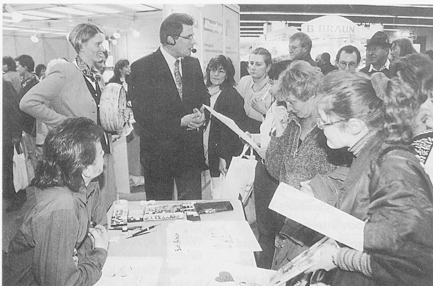
Besichtigungen, Informationen, Aktionen: Die 637 Aussteller boten in sieben grossen Messehallen alles, was auf dem Altenhilfemarkt heute zu haben ist.