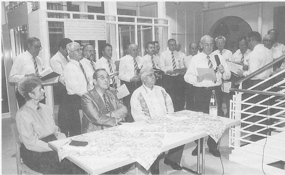
Vernissage: Das Buch von Dumeni Capeder wurde im Steinhof im Rahmen einer gutbesuchten Vernissage vorgestellt. Die Laudatio hielt Dr. Walter Gut, Präsident VCI, für die musikalische Umrahmung sorgte in sympathischer Weise der Chor virit romontsch Lucerna.