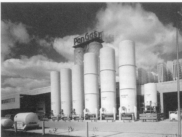
Das Umfüllwerk Dagmersellen stellt die Versorgung der Zentral-, Nord- und Südschweiz mit technischen und medizinischen Gasen und Gasgemischen sicher.

dizinalgasen wurde, die Vielfalt der Anwendungsbereiche verdeutlichend, 1984 in PanGas umbenannt. PanGas, mit Hauptsitz in Luzern-Kriens, hat am 25. April 1997 die stufenweise erfolgte Inbetriebnah-