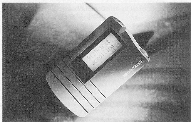
Telecourier U912T: Der ideale Personenrufempfänger mit zweizeiligem Textdisplay für den Einsatz in Spital und Heim.

Für weitere Informationen: Ascom Telematic AG Marketing Mobile Stettbachstrasse 6 8600 Dübendorf Telefon 01 631 11 11 Fax 01 631 23 29