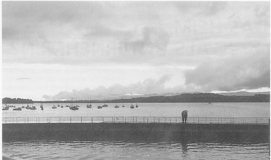
Ein «Föhnloch» über dem Murtensee ...