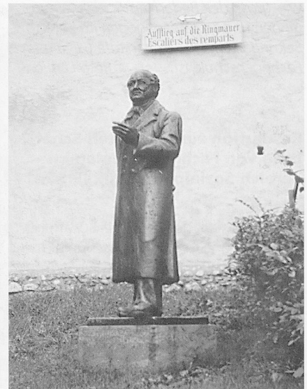
Statue vor dem Kirchgemeindehaus in Murten.