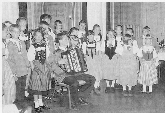
Rund 90 «Ehemalige» trafen sich in Langenthal, um zu plaudern und Neuigkeiten und Erinnerungen auszutauschen.