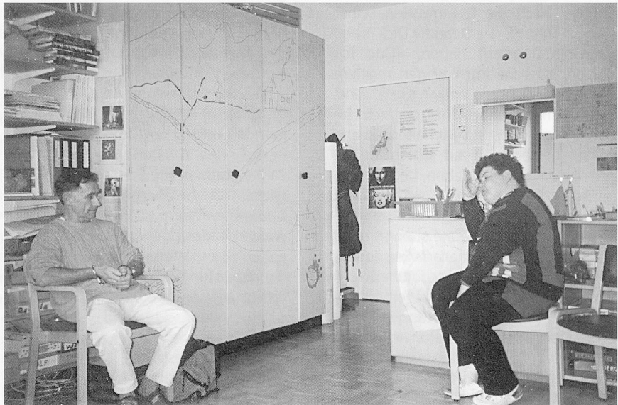
Das Verhör (man beachte die Handschellen!).

mit Körperarbeit, mit Wahrnehmung oder mit verschiedensten Formen der Theaterarbeit auseinandersetze.