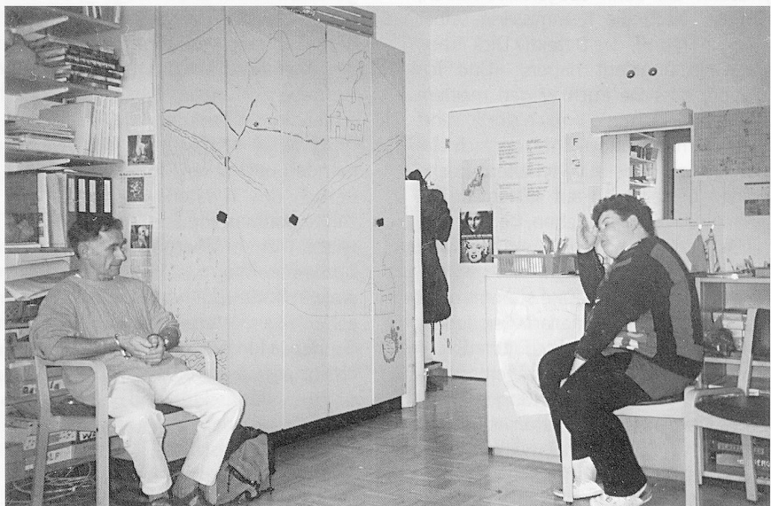
Das Verhör (man beachte die Handschellen!).

mit Körperarbeit, mit Wahrnehmung oder mit verschiedensten Formen der Theaterarbeit auseinandersetze.