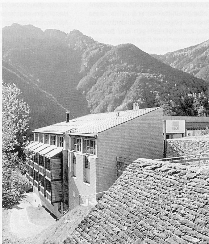
Mit Blick über das Tal: Das neue Sozialzentrum von Onsernone.

Die Sozialen Dienste integrieren das SZO in der Bevölkerung und brachten qualifizierte Arbeitsstellen ins Tal. In der schönen, hellen und funktionellen Küche werden die Mahlzeiten für die Hausgäste, das Personal, die Kinder und die Schullehrer vorbereitet: insgesamt wird für ungefähr hundert Perso-