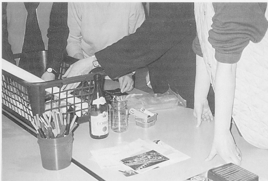
Gemeinsames Sortieren von Abfällen.

Wir können Abfälle zwar trennen, verpacken, kanalisieren und filtrieren. Solche Massnahmen vermochten die anfallende Abfallmenge bisher jedoch nicht zu reduzieren. Im Gegenteil: Seit 1960 hat sich die Menge der jährlich anfallenden Abfälle pro Person in der Schweiz mehr als vervierfacht. Bei allen technischen Fortschritten im Bereich der Abfallentsorgung wird es uns nicht gelingen, Abfälle ungeschehen zu machen. Im «Abfall-Leitbild» des Oberaargauischen Pflegeheims in Wiedlisbach steht deshalb das Vermeiden von Abfällen an erster Stelle auf der Prioritätenliste. Erst danach folgen die Stichworte