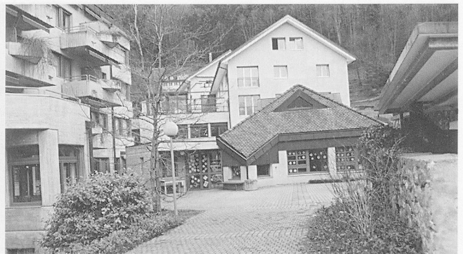
Januarhöck des ZHV im APH Rosenberg, Altdorf. Zum Altersheim-Gebäudekomplex gehört auch der Kindergarten, im Hintergrund (weiss) der neue Trakt...