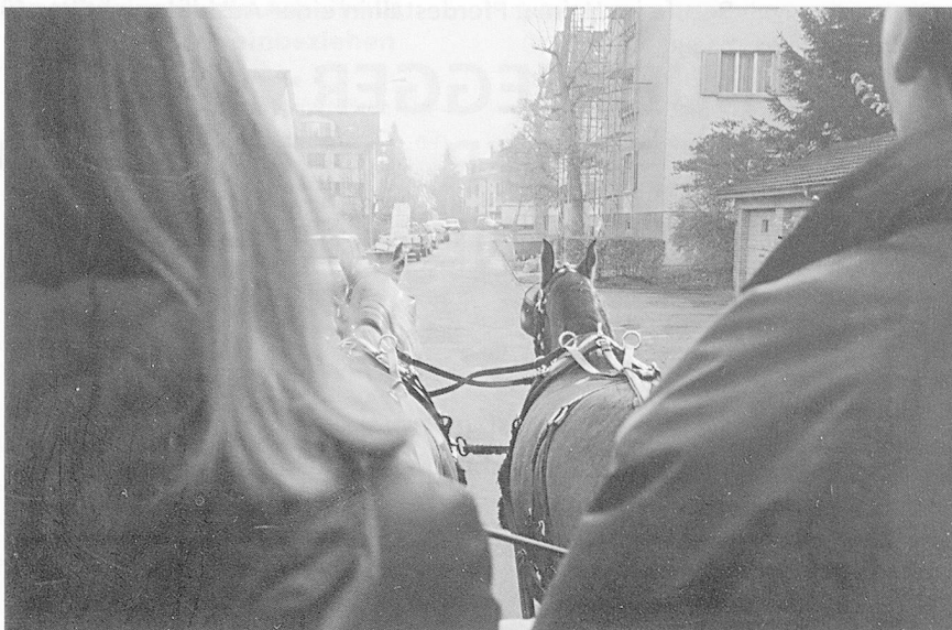
Ausfahrt im Liebefeld-Quartier.