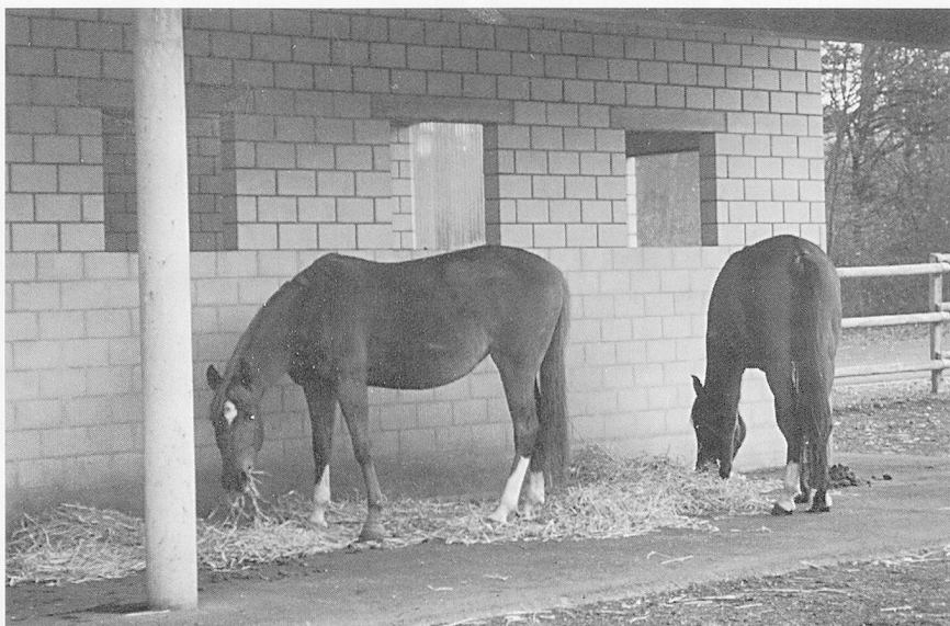
Bafran Sasha und Bafran Lagrisha vor ihrem Laufstall.

Die zweijährige Anlehre zur Pferdewartin ist eine junge Ausbildung. Sie ist auf Initiative des Schweizerischen Verbandes für heilpädagogisches Reiten (SV-HPR) in enger Zusammenarbeit mit dem Schweizerischen Verband für Berufsreiter und Reitschulbesitzer (SVBR)