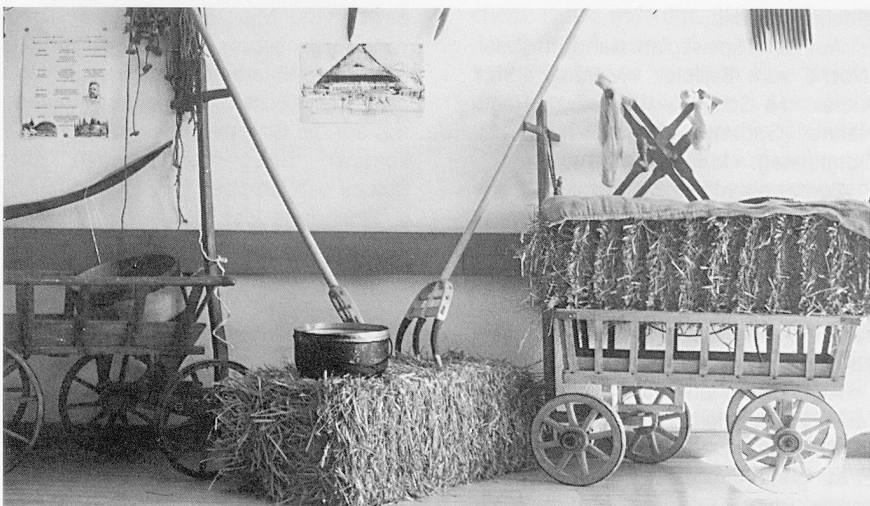
Erlebnisgastronomie in einem «ganz gewöhnlichen» Speisesaal.