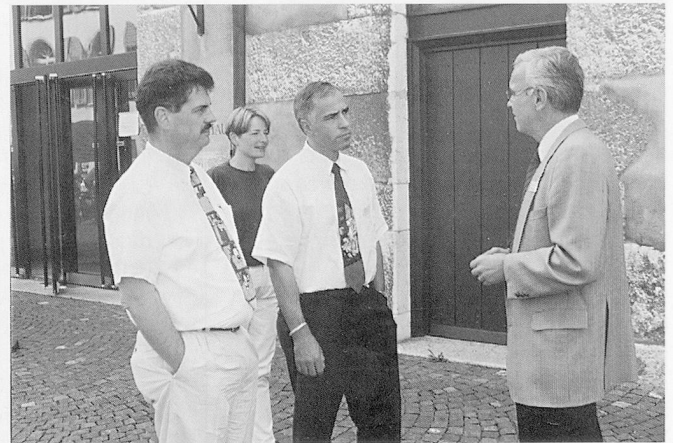
Zuhören ... und ausdiskutieren, jedes zu seiner Zeit.