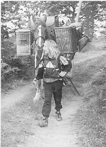
Phönix am langen Zügel.

Als wir den Kindern mitteilen, dass das Trekking zu Ende sei, gab's einerseits Erleichterung, andererseits Tränen – der Abschied von den Tieren fällt schwer. Es sind da wirkliche Beziehungen entstanden. Anderthalbstündiger Abstieg, dann langes Warten, bis alle Menschen und Tiere mit dem Transporter auf Kurts Hof verfrachtet worden sind. Auf einer ne-