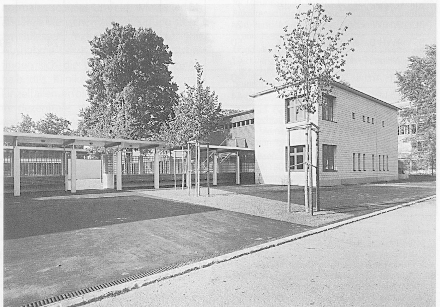
Wohneinrichtungen auf dem Klinikgelände: Das «Sternbild» in Königsfelden.

Annähernd die Hälfte der befragten Institutionen gibt an, dass die Wohngruppen über ein eigenes Finanzbudget verfügen, das sie eigenständig verwalten. So können die Gruppen das Geld eigenverantwortlich verwenden und