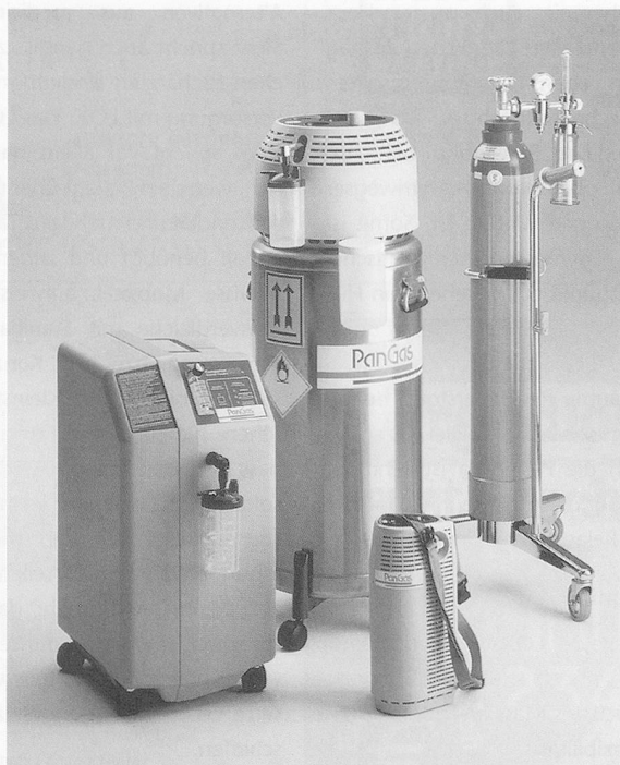
Alternative Sauerstoffquellen für die Durchführung der Sauerstoff-Langzeit-Therapie.

Trotz des Fortschritts in der Geräteentwicklung darf ein wichtiger Aspekt, der von der Mehrzahl der Patienten als störend empfunden wird, nicht unerwähnt bleiben. Bei längerer Therapiedauer ist das Betriebsgeräusch wie auch die grosse Wärmeentwicklung eines Konzentrators äusserst unangenehm. Ein weiterer Nachteil dieser O 2 -Versorgungsart ist, dass der Patient nicht mobil ist, also an seine Wohnung gebunden bleibt. Demgegenüber steht allerdings der nicht unbedeutende Vorteil, dass