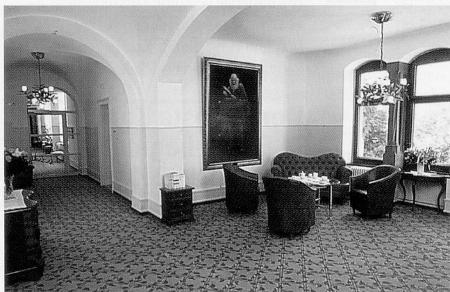
Sitzmöbel und Teppichboden sind farblich abgestimmt und verleihen der Raumzone im Altersheim Singenberg eine angenehme Atmosphäre.