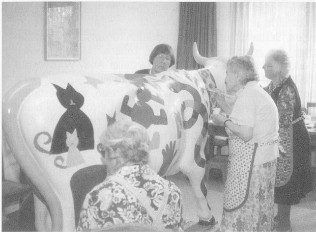
Man bemalt nicht jeden Tag eine Kuh...

B.Sch. Den Bewohnerinnen und Bewohnern des Altersheims «am Buck» in Hallau bot sich die Möglichkeit, dank einer grosszügigen Geste der Firma Klarer Freizeitanlagen Hallau, eine der inzwischen weltberühmten Kühe zu bemalen. Am 25. Juni wurde das Werk im Rahmen einer Vernissage der Öffentlichkeit präsentiert.