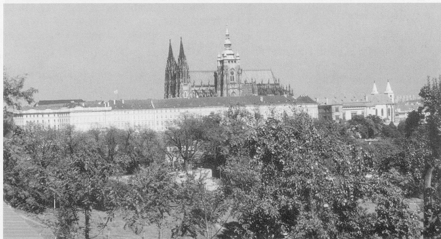
Septembertag in Prag: Das Gold des Herbstes über der Goldenen Stadt.