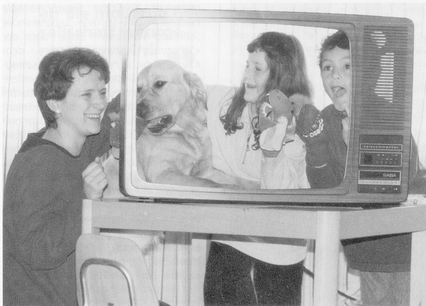
Moderne Form des Kasperltheaters: Rollenspiele mit dem Medium Fernsehen in der logopädischen Therapiestunde.