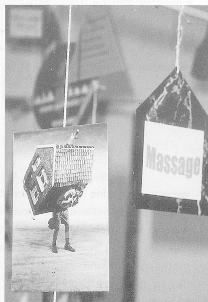
Gesprächsgruppen zu den Themen Gewalt, Sucht und Alkohol: Ganz andere Problematiken als vor 10 Jahren. Bild: Installation zum 10-Jahr-Jubiläum der Wohngruppen Baselland.

ist nicht einfach: Wir haben zu kämpfen mit den Jugendlichen. Oft werden wir im ersten halben Jahr der Arbeit mit einem Jugendlichen einfach angelogen, mit allen Spielchen konfrontiert. Bis wir ihm aufzeigen können, dass er eigentlich nicht uns, sondern sich selbst belügt. Dann kann eine Vertrauensbasis entwickelt werden.