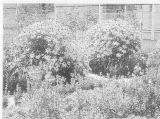
BETHESDA Küsnacht – Heim für Langzeitkranke und Betagte/Physiotherapie.

dort aber keine Arbeitsbewilligung erhalten. Irgendwie bin ich auf die Schweiz aufmerksam geworden. Also bin ich zu Hause auf unser Städtisches Arbeitsamt gegangen und habe nachgefragt, wie ich eine Stelle in der Schweiz erhalten könnte. Zur gleichen Zeit wurden die Stagiaire-Abkommen mit der Schweiz unterzeichnet. So war ich zur rechten Zeit am rechten Ort. Dann ging alles sehr schnell!