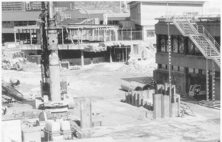
... oder ein Bauplatz, wie der Flughafen Zürich?