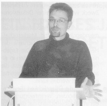
... oder auch durch Einzelreferate.