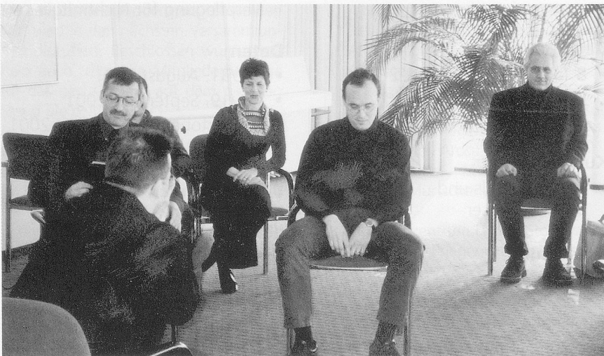
Die Präsentationen der Projektarbeiten ...

Ausgehend von Gedanken zum Thema Humor im Allgemeinen, stellen die Teilnehmerinnen in ihrer Arbeit zunächst einige Reflexionen zum eigenen Verständnis von Humor im Führungs- und Heimalltag an. In einem nächsten Schritt analysieren sie die Kräfte und Wirkungen von Humor. Für die Gruppe ist Humor eine Kraft, die es erlaubt, sich von